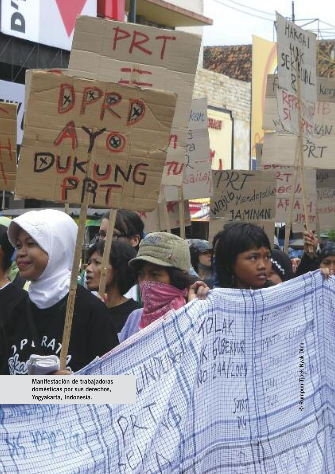
Manifestación de trabajadoras domésticas por sus derechos, Yogyakarta, Indonesia.